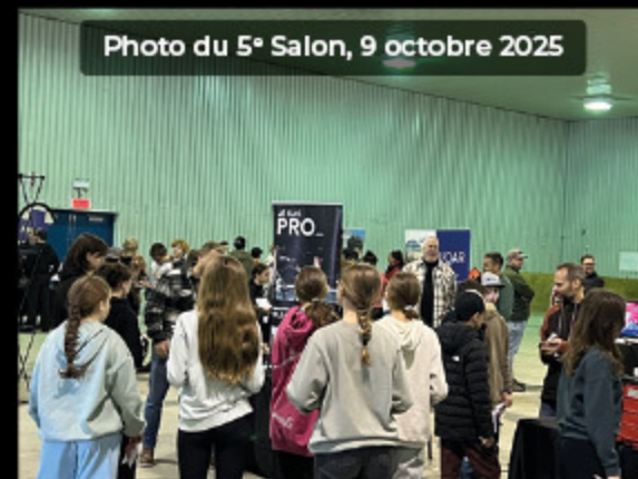
Photo du 5 e Salon, 9 octobre 2025

un atout important pour notre région. Nos actions mettent de l'avant ces opportunités et cette belle variété disponible pour les jeunes de notre région et d'ailleurs. Le secteur de la construction, c'est des carrières de haut niveau de profils variés, diversifiés. Le défi pour les prochaines années est de répondre aux besoins de notre industrie. Tous les intervenants dans le domaine collaborent à préparer la prochaine génération.