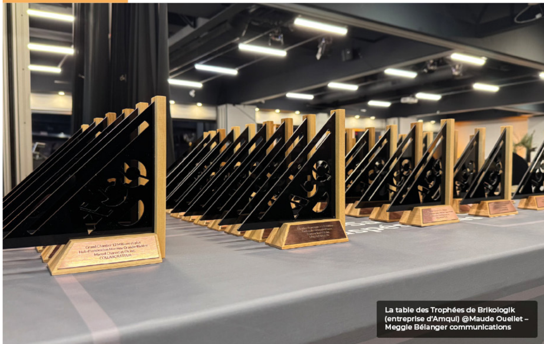
La table des Trophées de Brlkologik (entreprise d'Amqui) @Maude Ouellet - Meggie Bélanger communications