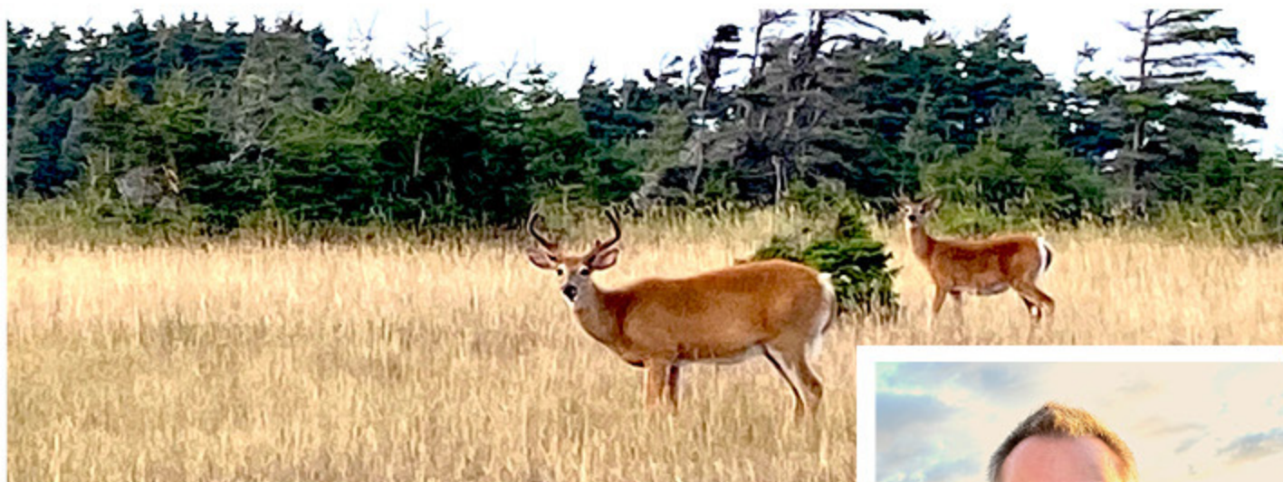
Pour la reprise de la chasse du cerf en 2026 dans la réserve Rimouski, la période aura lieu du 9 au 14 octobre inclusivement.

Dan Gagnon précise aussi que la chasse sera autorisée dans des zones ciblées où les observations des cervidés ont été les plus significatives. Et non dans l'ensemble de la réserve qui a déjà accueilli une trentaine de groupes, lors des belles années du chevreuil. Ce territoire était jadis reconnu comme étant le «paradis du cerf de Virginie», une appellation alors en usage. En plus de la chasse en hébergement, les amateurs pouvaient aussi pratiquer la chasse au quotidien, dans des zones qui leur étaient réservées.