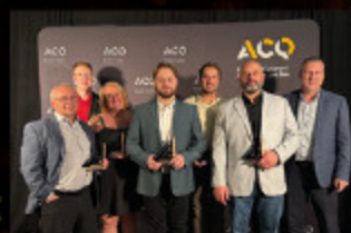
Hub Innovation Mélinov-Grande-Rivière

418 862-6220 | www.leselectriciensdesjardins.com