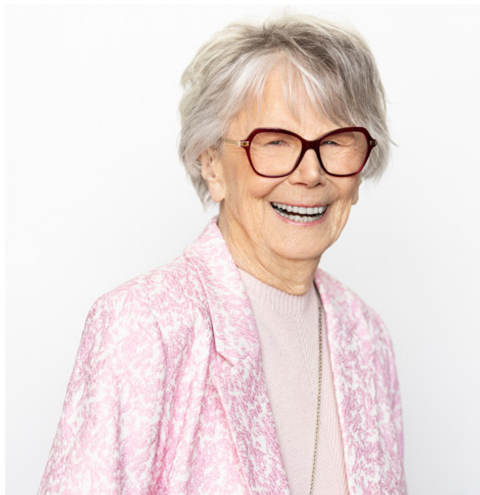
Béatrice Picard est décédée le 9 décembre à l'âge de 96 ans.

En 2017, à 88 ans, elle a incarné Maude dans Harold et Maude chez Duceppe. Sa filmographie compte plus de 250 productions. En 2022, elle a tourné dans Suzanne et Chantal , un court métrage qui a remporté le Prix du public au Festival Regard à Saguenay.