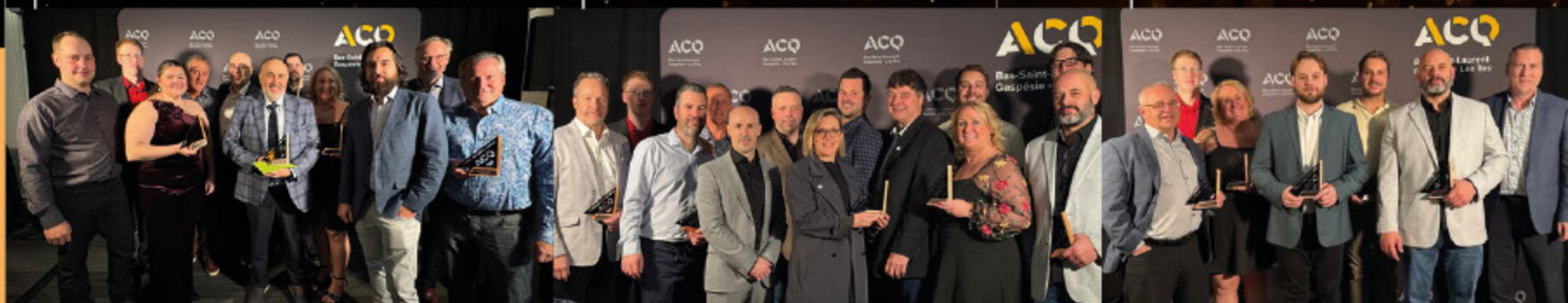
Hub Innovation Mérimov- Grande-Rivière