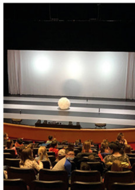
Chandler a repris en main les activités de Sapinart.

Le fait d'ajouter Chandler au circuit des artistes qui s'arrêtent à New Rich-