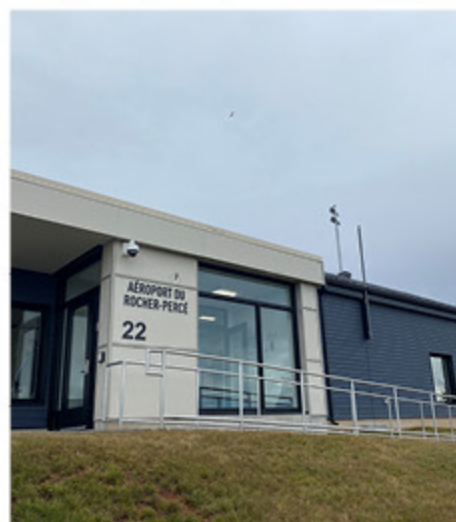
L'aéroport de Grande-Rivière.

Il a affirmé être favorable au déglacage, convenant cependant que le repli à l'aéroport du Rocher-Percé à Grande-Rivière n'était pas optimal.