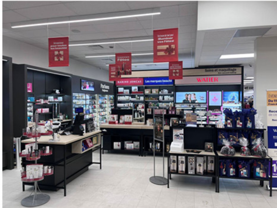
La nouvelle succursale Jean Coutu a été inaugurée, le 11 septembre dernier, à New Richmond.

L'aire de vente a été reconfigurée et le secteur des cosmétiques a bénéficié d'une refonte complète sous le