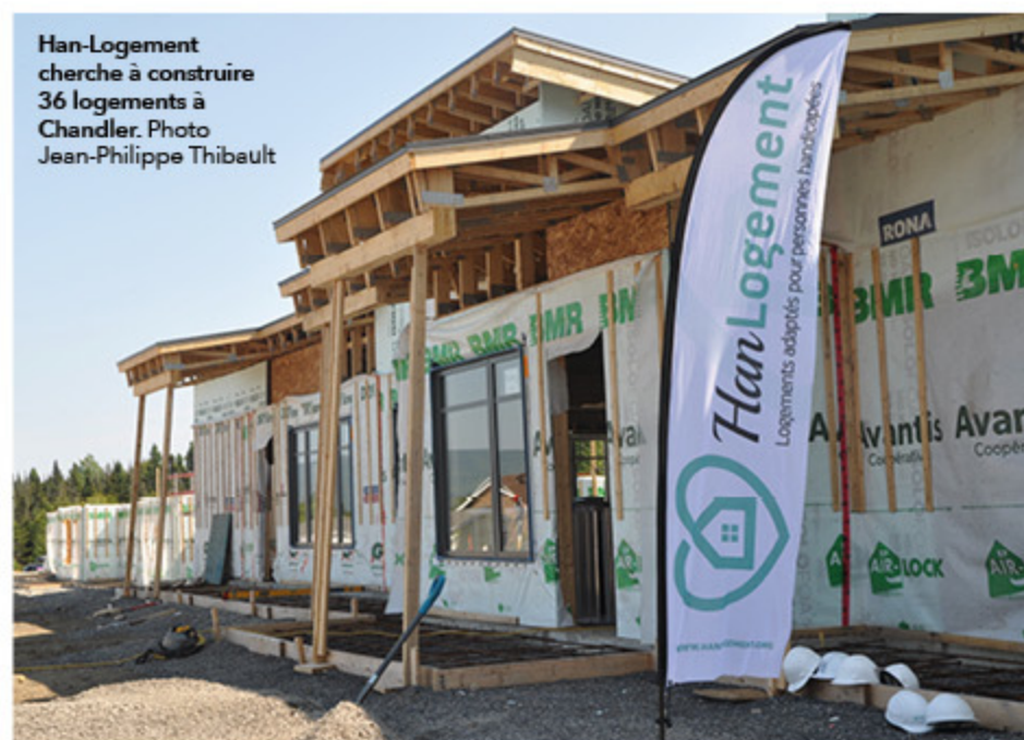
Han-Logement cherche à construire 36 logements à Chandler.

Le maire de Chandler affirme que Han-Logement demande trop de concessions pour s'établir dans sa ville. Des négociations sont en cours afin de trouver un terrain d'entente.