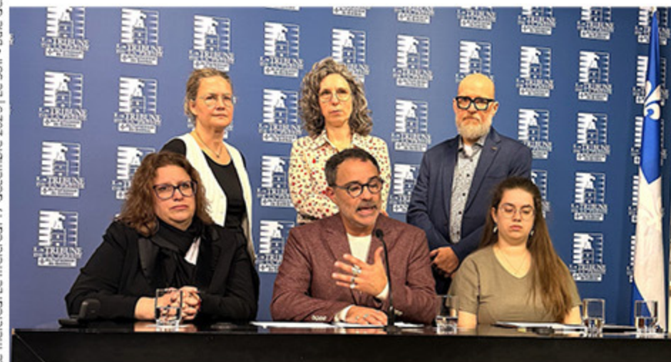
Les directions de musées régionaux le 28 octobre à Québec.