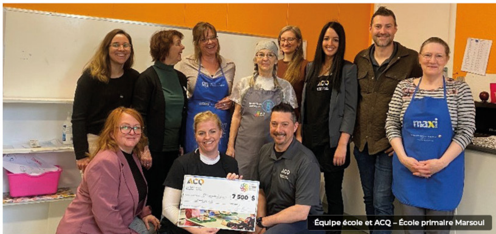
Équipe école et ACQ – École primaire Marsoul

recueilli. À chaque fois, c'est toujours un des moments les plus gratifiants pour nous. L'énergie, l'authenticité et la générosité des bénévoles de ces clubs sont inspirantes. Nous avons le sentiment de faire ce qu'il faut, c'est du pur bonheur ! Depuis 2014, l'association a remis : 84 000 $.