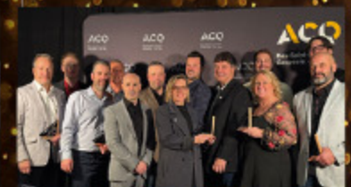
Poste de Police Listuguj Mi'Gmaq